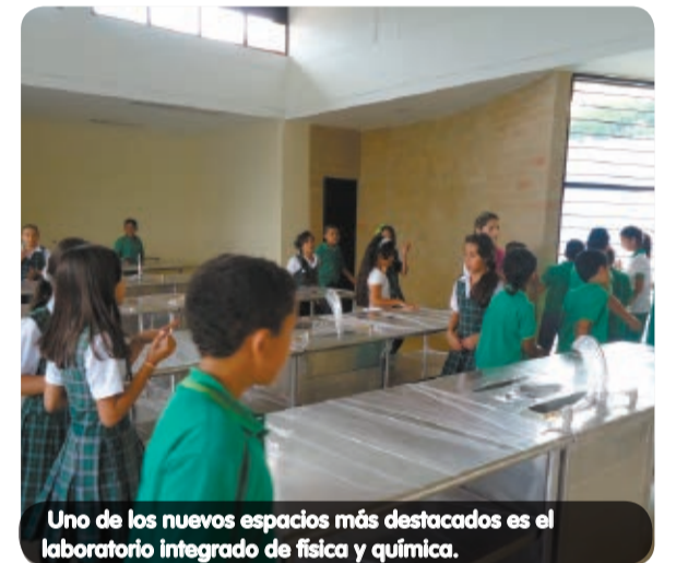
Uno de los nuevos espacios más destacados es el laboratorio integrado de física y química.