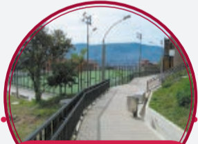
Circuito de movilidad El Triunfo (I etapa) $4.518 millones