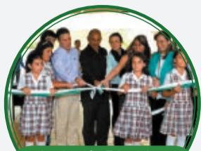
Institución Educativa El Triunfo Santa Teresa $6.874 millones