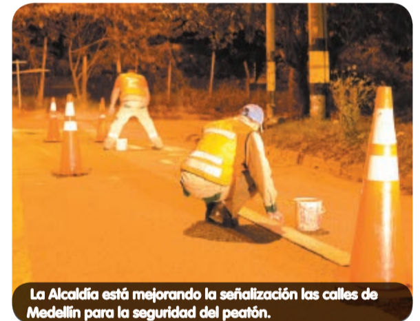
La Alcaldía está mejorando la señalización las calles de Medellín para la seguridad del peatón.

$1.450 millones invertidos en señalización vertical en Medellín.