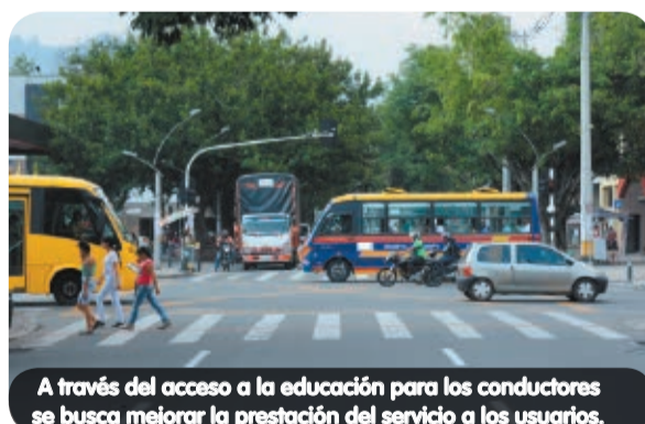
A través del acceso a la educación para los conductores se busca mejorar la prestación del servicio a los usuarios.

El Sistema Integrado de Transporte del Valle de Aburrá, que inició en octubre de 2013 y ya cuenta con 4 meses de operación en los sectores de Belén y Aranjuez, tiene como propósito mejorar las condiciones en la prestación del servicio con calidad, eficiencia, economía y seguridad.