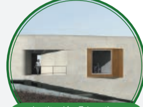
Institución Educativa Doce de Octubre $2.586 millones