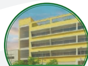
Institución Educativa Jorge Eliecer Gaitán $5.023 millones