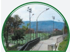
Circuito de movilidad El Triunfo $2.757 millones