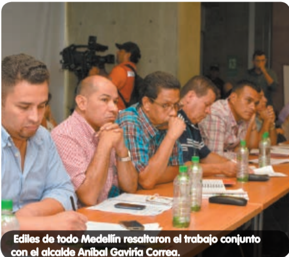
Ediles de todo Medellín resaltaron el trabajo conjunto con el alcalde Aníbal Gaviria Correa.

Plaza Mayor fue el escenario en el que los ediles de la Junta Administradora Local (JAL) de la Comuna 6 se reunieron con el alcalde de Medellín, Aníbal Gaviria Correa, para hacer seguimiento al avance de diferentes proyectos que se ejecutan en esa zona de la ciudad.