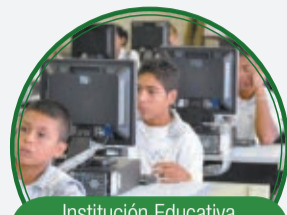
Institución Educativa El Triunfo Santa Teresa anexo El Triunfo $1.870 millones