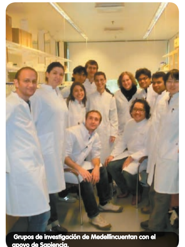
Grupos de investigación de Medellín cuentan con el apoyo de Sapiencia.

Los trámites e información referente a la Agencia Sapiencia estarán disponibles en los Mascerca, Casas de Gobierno y Centros de Servicio a la Ciudadanía de las 16 comunas y 5 corregimientos de la ciudad, como una apuesta de la Alcaldía de Medellín por facilitar el acceso de la comunidad a estos servicios, por lo que se adelantó un proceso de capacitación en trámites y asesoría a los servidores de estas oficinas.