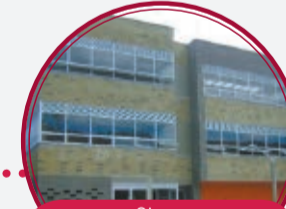
Obras complementarias Centro Cultural Pedregal $1.606 millones