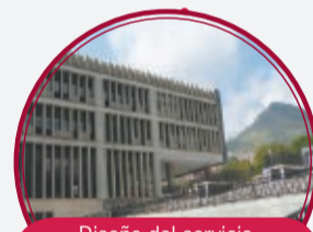
Diseño del servicio de urgencias U.H. Doce de Octubre $214 millones