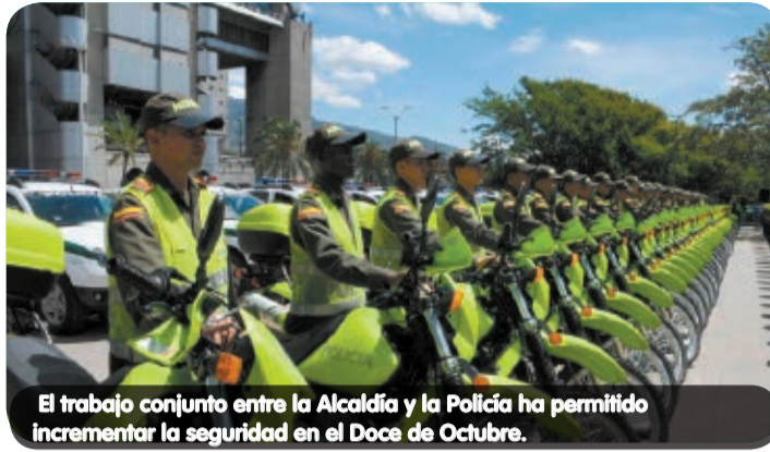
El trabajo conjunto entre la Alcaldía y la Policía ha permitido incrementar la seguridad en el Doce de Octubre.

en consecuencia, se han reducido considerablemente los hurtos a personas así como el robo de automóviles en la comuna.