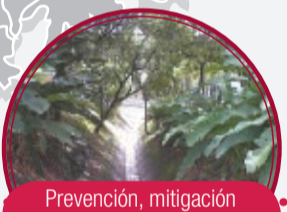
Prevención, mitigación y control de eventos hidrológicos en las quebradas Las Tinajas, La Mica, La Mica 1 y La Castro $504 millones