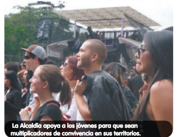
La Alcaldía apoya a los jóvenes para que sean multiplicadores de convivencia en sus territorios.

desarrollo del individuo y el acompañamiento en las familias como actores principales en el proceso. La línea educativa que brinda oportunidades de acceso a la educación formal y no formal desarrollando competencias pedagógicas que le sirvan para enfrentarse a la vida laboral. Finalmente, la línea ocupacional que vincula por primera vez al joven a un trabajo digno mejorando la calidad de vida de él y el de su familia.