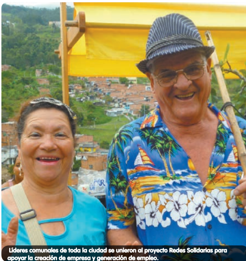
Líderes comunales de toda la ciudad se unieron al proyecto Redes Solidarias para apoyar la creación de empresa y generación de empleo.

Redes Solidarias está también cerrando las intervenciones técnicas y asociativas que se hicieron con las unidades productivas, y se encuentra en la fase de conformación de la red empresarial de la Comuna 6 que priorizarán inversión para fortalecer seis nodos sectoriales en todo Medellín: 3 del sector de textil, confección, diseño y moda; 1 de servicios; 1 de alimentos y 1 de sustancias y productos químicos.