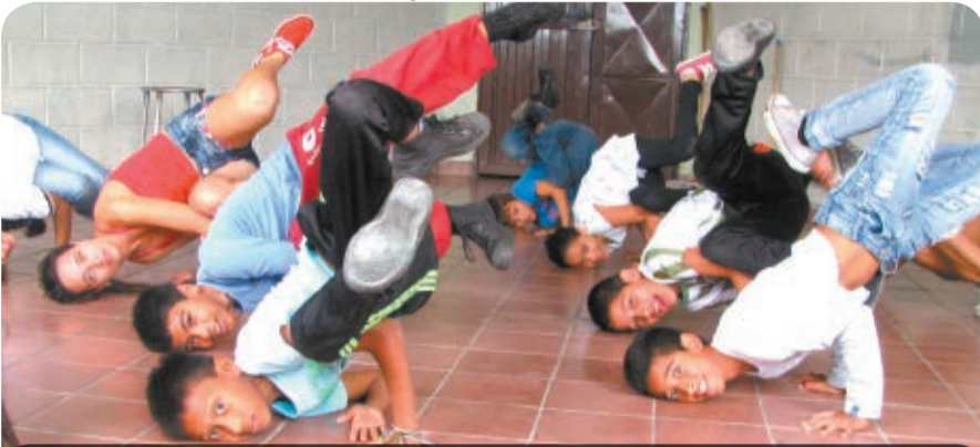
Por medio del arte, niños y adolescentes de Medellín aportan a la creación de ambientes para la vida.

Los niños y niñas del Doce de Octubre, acompañados por sus padres, familiares, profesores y amigos, disfrutaron este trimestre de los espacios para el deporte, la cultura y la recreación que facilitaron los encuentros de Pedagogía Vivencial, un proyecto de la Unidad de Niñez de la Secretaría de Inclusión Social y Familia.