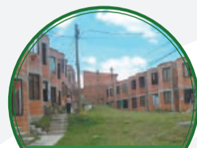
OPV Camino Hacia el Futuro $40 millones