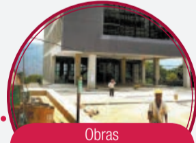
Obras complementarias Parque Biblioteca Doce de Octubre $1.614 millones