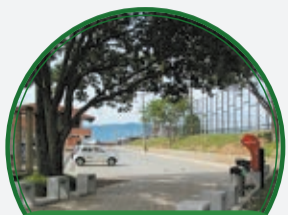
Centralidad El Progreso N° 2 $3.772 millones