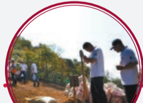
Ecoparque Mirador del Cerro El Picacho, etapa 2 $1.040 millones