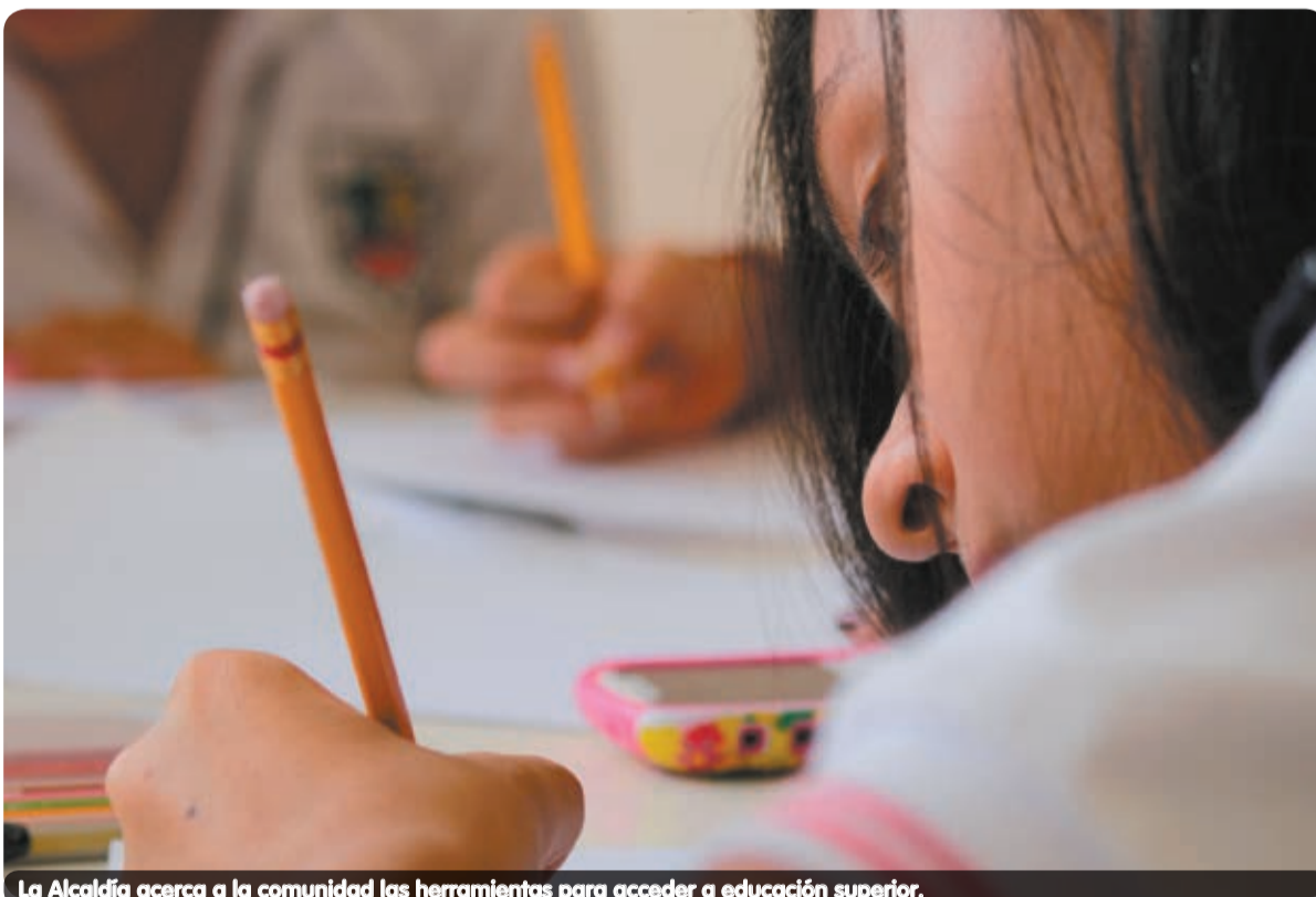
La Alcaldía acerca a la comunidad las herramientas para acceder a educación superior.

En el Centro de Servicios a la Ciudadanía Doce de Octubre, ubicado en la Inspección 6, calle 103 Nro. 77 B-56, se pueden hacer ahora los trámites de la Agencia de Educación Superior de Medellín (Sapiencia).