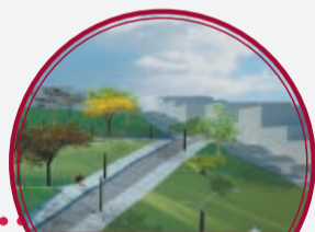
Parque 12 de Octubre (II Etapa) $826 millones