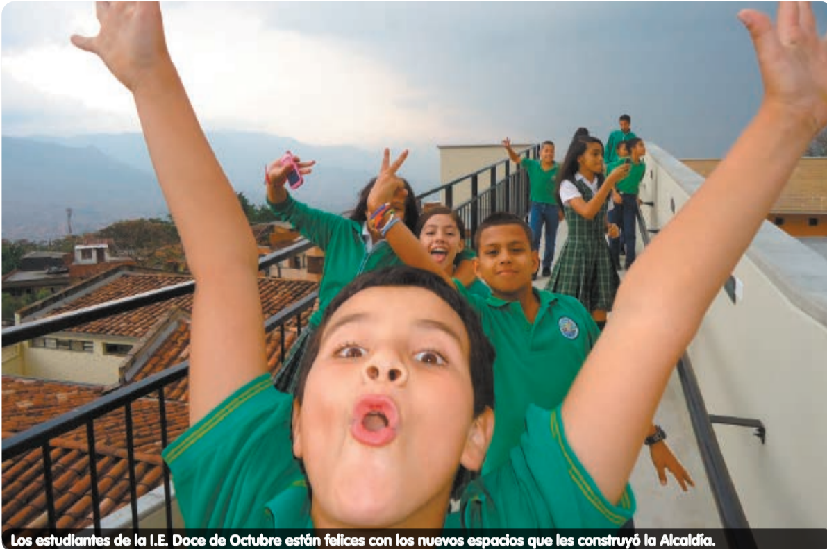
Los estudiantes de la I.E. Doce de Octubre están felices con los nuevos espacios que les construyó la Alcaldía.

El compromiso de la comunidad es evidente durante la ampliación y mejoramiento de la I.E. Doce de Octubre y hoy, tras un año de arduo trabajo para unos y de mucha paciencia para otros, ya están listos los espacios en los que la tecnología y los espacios de calidad irán de la mano con el disfrute del aprendizaje.